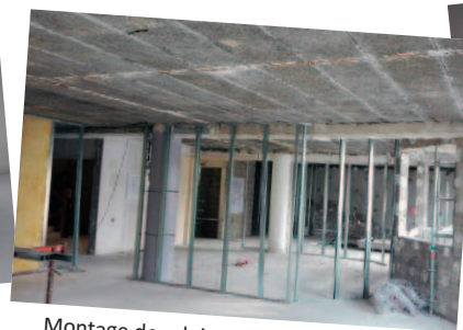
Montage des cloisons