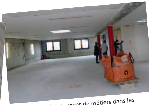
Travail des différents corps de métiers dans les délais et devis impartis