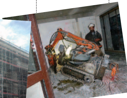
Découpage du béton armé au moyen d'un robot