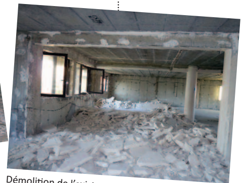
Démolition de l'existant