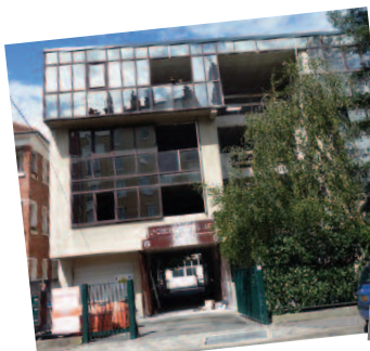
Maintien du bâtiment malgré les modifications de charges