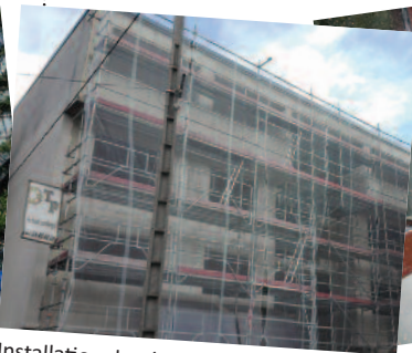
Installation des échafaudages